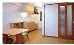
リビングダイニング