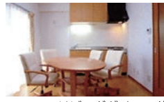
リビングダイニング